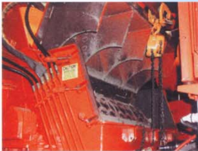
油圧式フードにより、スクリーンのメンテナンスが短時間で容易に行えます。(Model2600は除く)