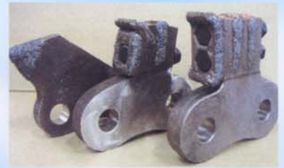
破碎歯は高耐久タングステンカーバイトにより非常に経済的です。