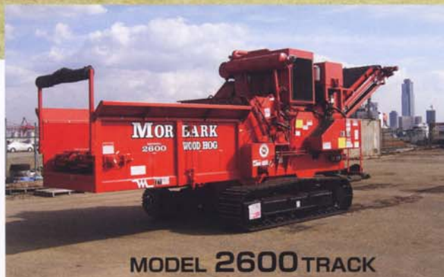
MODEL 2600 TRACK