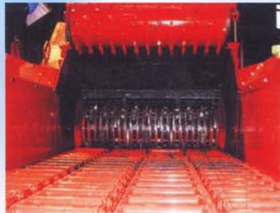
チェーンベルトと大径フィードロールにより安定した供給と大容量の処理が可能です。