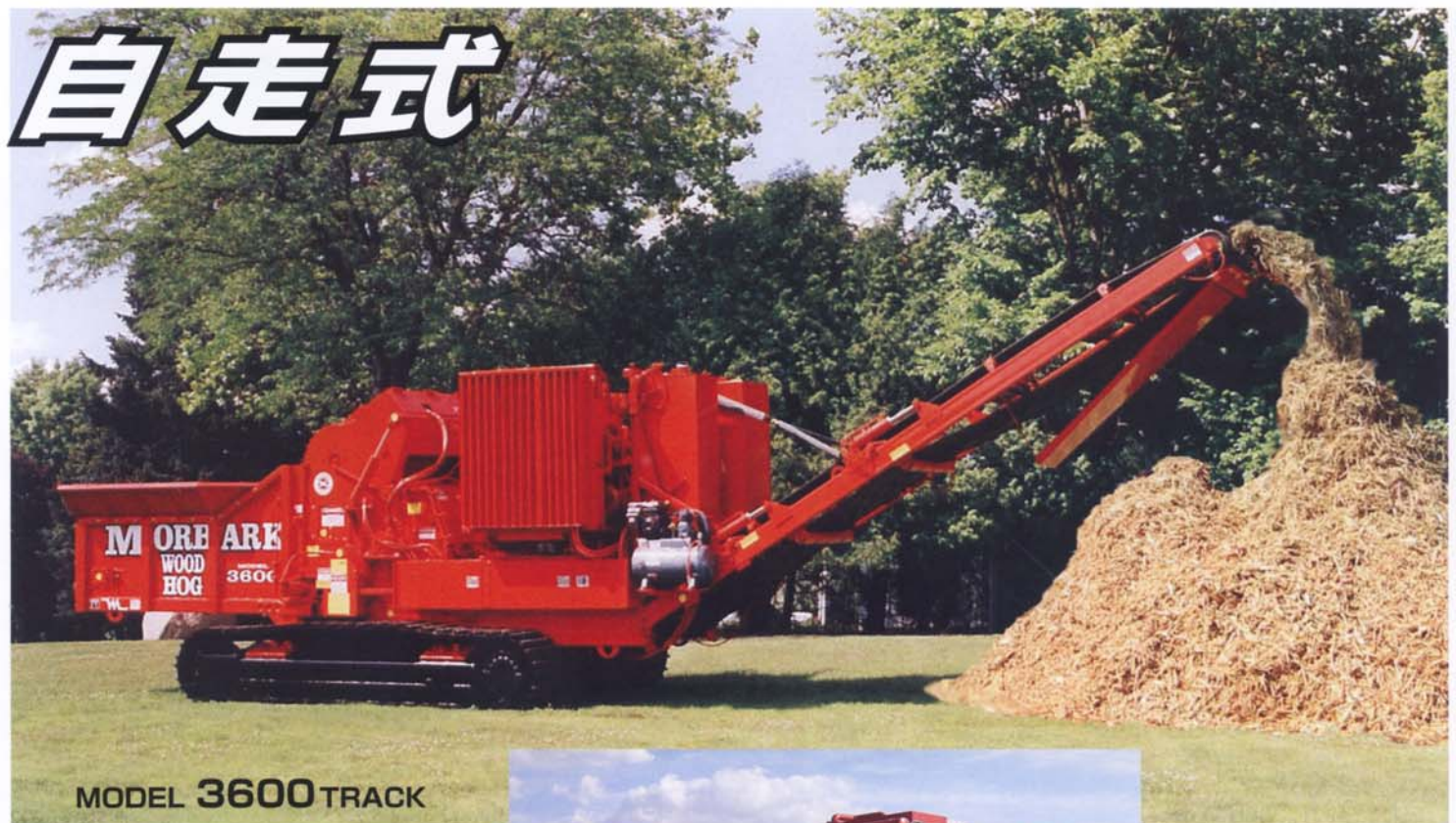
MODEL 3600 TRACK