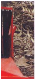
チップが周 り、より高い

ここ日本においてもその性能と品質に大きな評価を受けております。 を用意し、抜群の操作性にて作業が行えます。